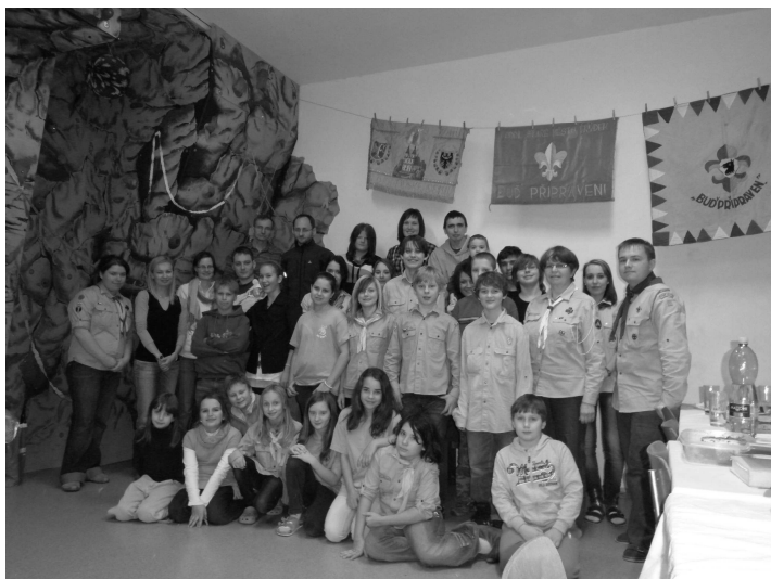
Naší členové oddílu 1.St.M.

Krásný dort k našemu výročí byl vynikající a všichni si moc pochutnali